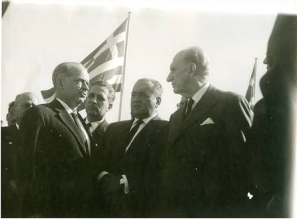
Ο διευθυντής της Εθνικής Πινακοθήκης Μαρίνος Καλλιγιάς στην τελετή θεμελίωσης του κτιρίου