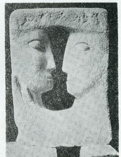
Μπέλλας Ραφτοπούλου : « Σύνθεσις σε πέτρα »