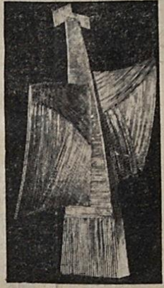
Ρ. ΕΥΘΥΜΙΑΔΗ: Φτερωτὸς Ἄρχοντας.

Ἡ ἀγάπη τῆς γιὰ τὸ ζωικόν, ἢ φυσικόν κόσμον δὲν εἶναι μόνον παθητικὴ, ἀλλὰ καὶ πηγὴ ἐμπνεύσεως. Στὸ ἔργο τῆς Μενεγάκη, πῶς βλέπουμε ἐκ-