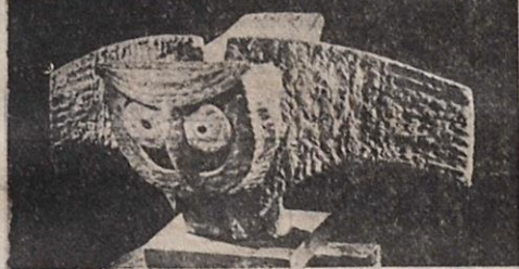
Μία ἀπὸ τῆς κοικουβούγιες τῆς Φ. Εὐθυμιάδου.

Ἡ Εὐθυμιάδου προσφέρει ἐντονα αἰσθητικῆς ἀπολαύσεως μὲ τὴν εἰλικρινεῖαν καὶ τὴν στερεότη-