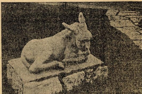
Ένα έργο της Φρόσως Ευθυμιάδη πὸ στολίζει τὸν ήφιπο μιάς βίλλας στα προάστια τὸν 'Αθηνῶν.

Δεν νομίζω πὸς χρειάζεται να προσθέσω θερμά λόγια και άλλων τεχνοκρίτων όπως του άρχαιολόγου Νικολάου Δελιά, τὸν Γεωργίου 'Αθη-