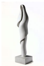
Η γυναίκα του Λωτ , 1962 μάρμαρο, 85X21X19 εκ. αρ. έργου 9151