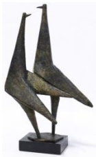
Πουλιά , 1955 χαλκός, 39,5X23,5X14 εκ. βάση δεξιά αρ. έργου 9081/α