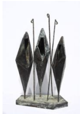
Ελληνες βοσκοί (ή Τσοπάνοι) , 1955 σφυρήλατο σίδηρο, 53X30X20,5 εκ. αρ. έργου 9152