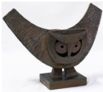
Κουκουβάγια , πριν το 1959 σφυρήλατο σίδηρο με χαλκό, 26X40,5X27 εκ. αρ. έργου 9082