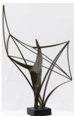
Αετός II , 1960 σφυρήλατος ορείχαλκος, 125X89X33 εκ. αρ. έργου 9154