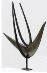
Πουλί , π. 1959 σφυρήλατος ορείχαλκος, 126,5X113,5X38 εκ. αρ. έργου 9153