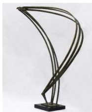
Γραφή στο διάστημα , 1960 σφυρήλατος ορείχαλκος, 90X70X28 εκ. αρ. έργου 9161