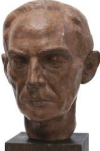
Δημήτρης Πικιώνης , 1941 τερακότα, 31X22X27 εκ. αρ. έργου 9101