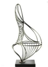
Νύμφη , 1960 σφυρήλατος ορείχαλκος, 138X67X43,6 εκ. αρ. έργου 9051