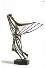
Νίκη , 1960 σφυρήλατος ορείχαλκος, 103,5X84X35,5 εκ. αρ. έργου 9157