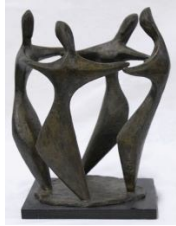
Ελληνικός χορός , 1955 χαλκός, 35,5X30X27 εκ. αρ. έργου 9138