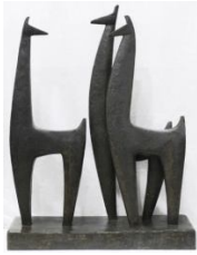
Ζώα των Άνδρων , 1954 σφυρήλατο σίδηρο, 120X98X34 εκ. αρ. έργου 9053