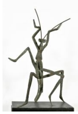
Σαλώμη , 1958 ή 1959 σίδηρο κομμένο με φλόγα οξυγόνου 130X89,5X55,5 εκ. αρ. έργου 9149