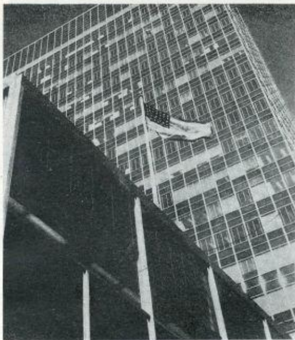
Το «Lever House» στην Ν. Υόρκη «Lever House» in N.York