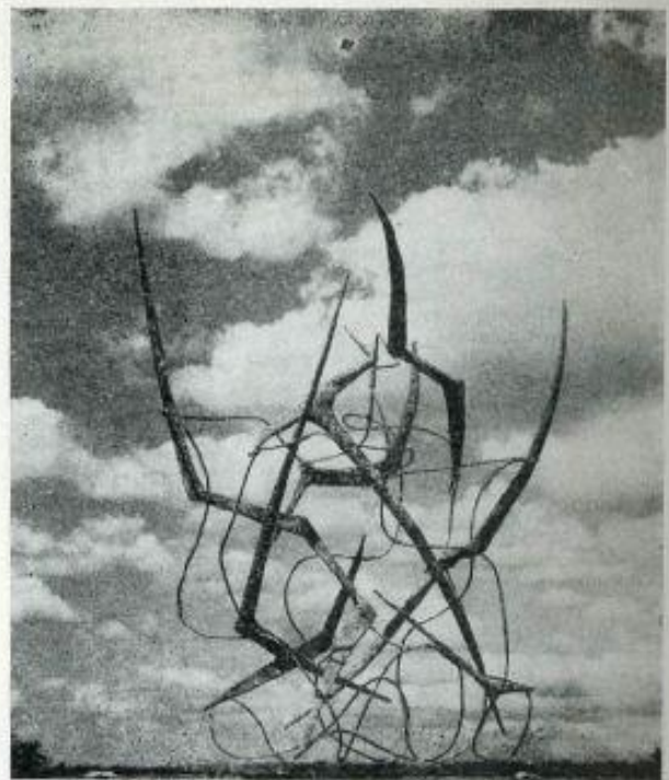
Γλυπτό από άργάλιο και μόλυβδο, του 'Αμερικανού γλύπτη Herbert Ferber Sculpture, bronze and lead, by Herbert Ferber, U. S. A.

Άν πάλι δεις τó Auditorium του Massachusetts Institute of Technology (M.I.T.), μέ τó επαναστατικό σχήμα του — ένός όγδδον σφαίρας, που μόλις άγγίζει τή γη σέ τρία σημεία, έτοιμο λες γιά άπογείωση, κι' ως τόσο κυρίαρχο τής μάζας του και πειστικό άπόλυτα στην έπίγειο άποστολή του, θαυμαστό στην έσωτερική του χωρονομία, γεμάτο λειτουργική άνυση, εύγένεια και φαντασία στην τελείωση των λεπτομερειών του έσωτερικού του χώρου. Τó Auditorium αυτό είναι ένδοξο έργο του Eero Saarinen, αυτού του « ίννοοατενι », και θαυμαστό δείγμα του πόσο ή άξιοποίηση των καταπληκτικών τεχνικών έπιτεύξεων του νέου κόσμου έπέτρεψε στον αρχιτέκτονα νά άπελευθερωθί από κάθε προίστορία αρχιτεκτονικού σχήματος και νά δημιουργήση αυτός, μέ μία θαυμαστή « integrity structurale » τó σχήμα που ταίριαζε στό πλαστικό του όραμα. (Στήν παρακείμενη εικόνα του έσωτερικού του Auditorium τά όρθωγώνια παννώ που κρέμονται από τήν όροφή είναι τά περίφημα