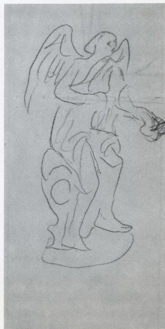
Άγγελος καθιστός. Μολύβι (18×9)