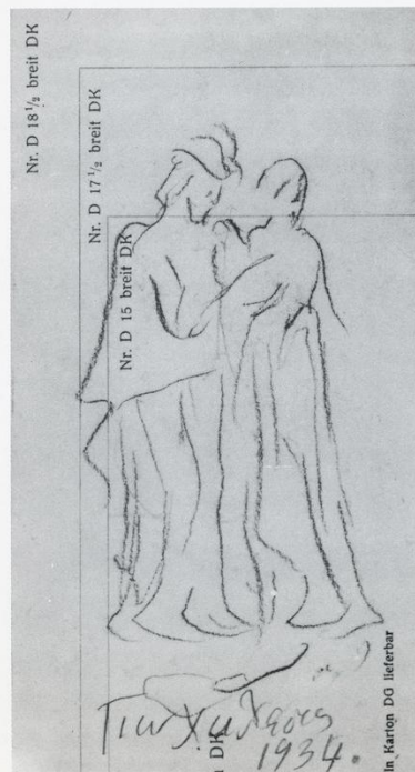
Παραμύθι της Πεντάμορφης. Μολύβι-κάρβουνο ενυπόγραφο 1934 (19×10).