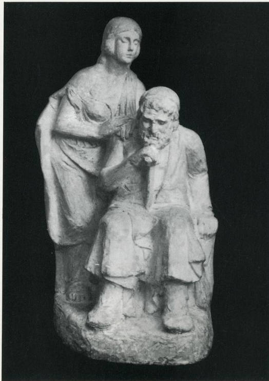
Οιδίπιδας και Αντιγόνη, 1930. Γύψος (77×33×45).

Επίσης ευχαριστούμε την LIPTON για τη χορηγία της.