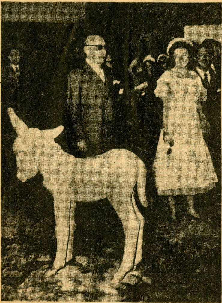
Ἡ Βασίλισσα μετὰ τοῦ Στρατάρχου Παπάγου κατὰ τὴν χθεσινήν ἐπίσκεψιν τῶν εἰς τὴν Διεθνή Ἀρχιτεκτονικὴν Ἐκθεσιν ποῦ ἦνοιξεν εἰς τὰς Λιθούσας τοῦ Ζαπτείου. (Ἐνα ἀπὸ τὰ ἐκθέματα τῆς κ. Φο. Εὐθυμιάδου).