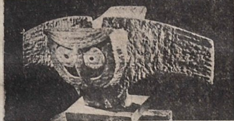
Μία από τις κουκουβάγιες της Φ. Ευθυμιάδη.

Η Ευθυμιάδη προσφέρει έντονας αισθητικές άπολαύσεις με την ελικρίνια και τη στερεότυ-