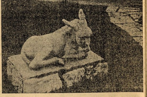
Ένα έργο της Φρόσως Ευθυμιάδης που στολίζει τόν ήλιο μίας βίλλας στο προάστια των Άθηνων.

Δεν νομίζω πώς χρειάζεται να προσέσω θερμά λόγια και άλλων τεχνόκρίτων όπως τού άρχαιόλογου Νικολάου της Γωνάσου Άθης