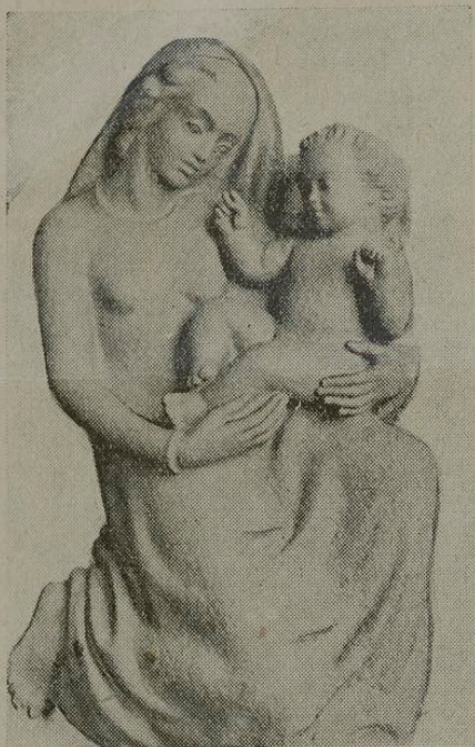
Ἡ Παναγία μετὸ Χριστό.

Ἡ ὕλη τοῦ πηλοῦ, ποὺ ὑπόκειται σὲ παραμορφωτικές μεταλλαγές, ἔπειτα ἀπὸ τὴν πρώτη ἐμφύσηση τῆς καλλιτεχνικῆς πνοῆς ἀπάνω της καὶ τῆ σχηματοποίησής της, εἶνε γνωστὸ ὅτι, ἂν δὲν ψηθῆ σὲ εἰδικὸ