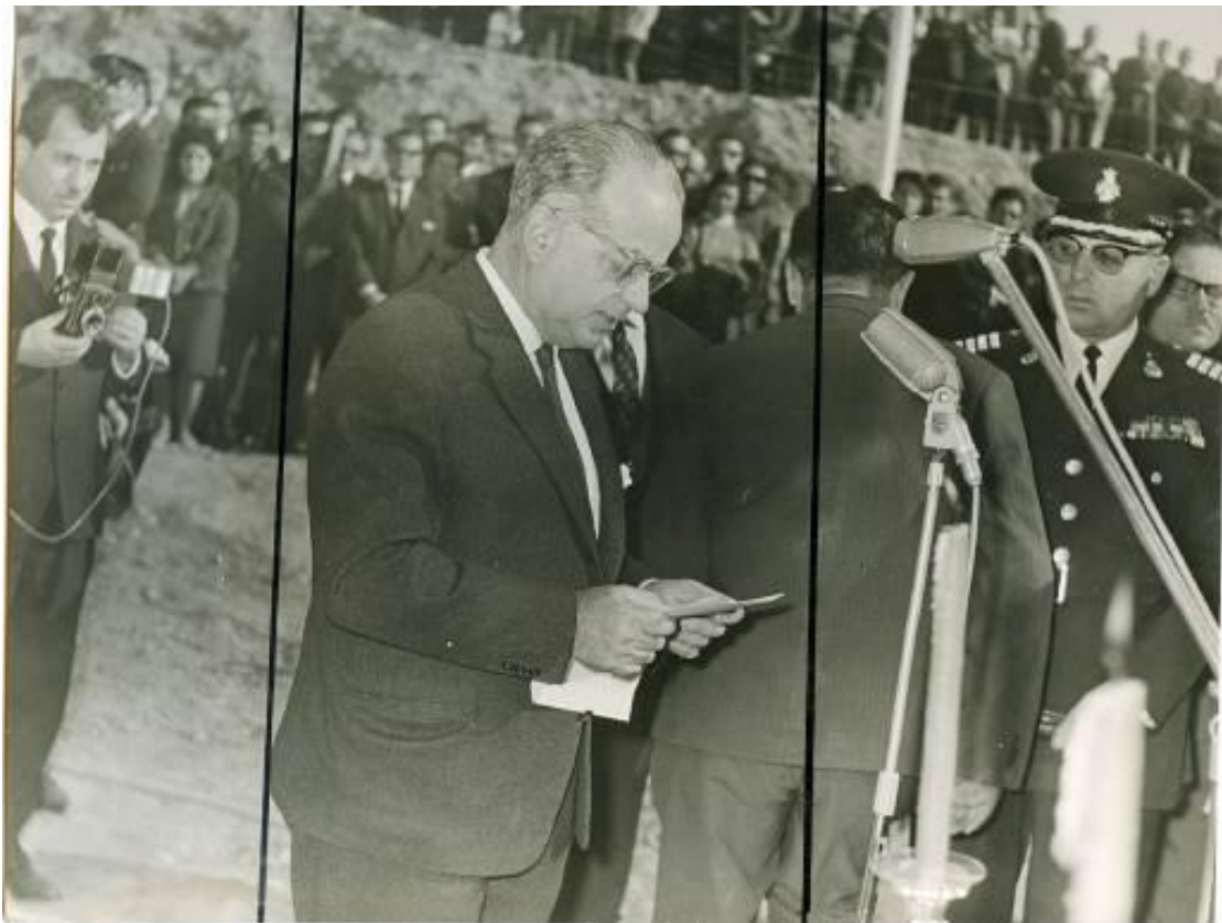
Ο διευθυντής της Εθνικής Πινακοθήκης, Μαρίνος Καλλιγás στην τελετή θεμελίωσης του κτηρίου