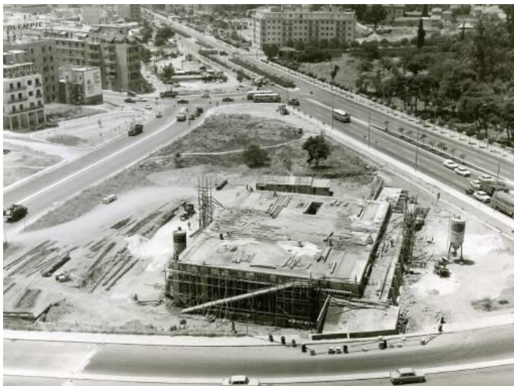
Το πρώτο τμήμα του συγκροτήματος της Εθνικής Πινακοθήκης στο στάδιο της κατασκευής